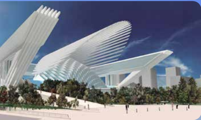
SEDE CONGRESO: PALACIO DE CONGRESOS Y EXPOSICIONES DE OVIEDO